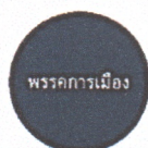
2. พรรคการเมือง