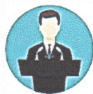
1. ผู้สมัคร